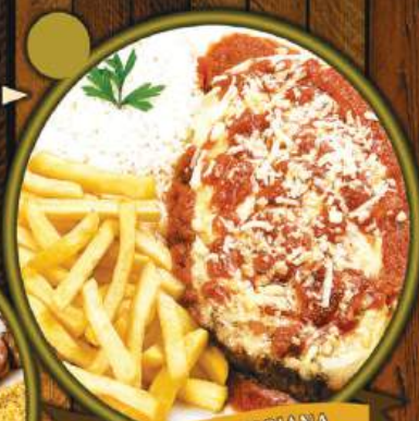
FILE À PARMIGIANA