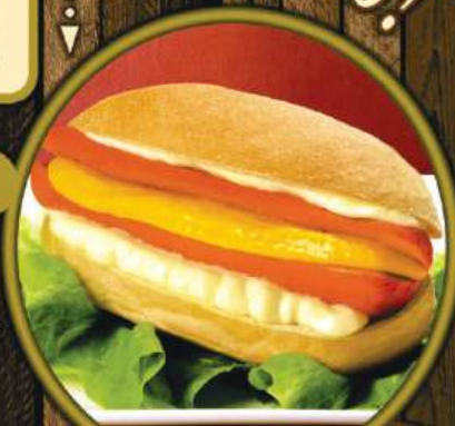
HOT DOG MAIONESE