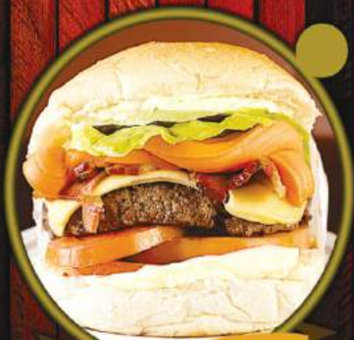
THE BEST BURGER

003 The Best Burger - Delicioso hamburger de picanha de 200g, queijo jato, cheddar, alface lisa, tomate, bacon e maionese da casa. Servido no big pão de hamburger.