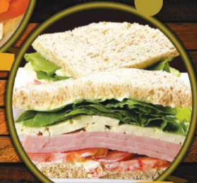
PEITO DE PERU