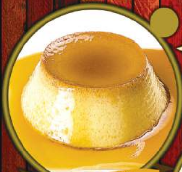
PUDIM DE LEITE