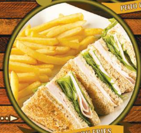
PEITO DE PERU FRIES