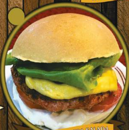
CHEESE CALABRESA SALADA